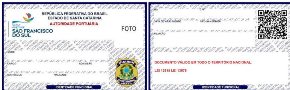
FIGURA 1 - MODELO DE IDENTIFICAÇÃO

É restrita ao Gerente de Segurança Portuária a autorização antecipada para emissão da identificação funcional do agente da guarda portuária.