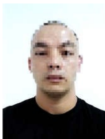
FIGURA 2 – MODELO DE FOTO

A foto deve ser no formato 3x4, padrão para documento, com fundo branco e de camiseta preta de malha, com gola redonda, conforme figura 2. Esta ficará alocada ao canto superior direito (frente) da carteira de identidade funcional.