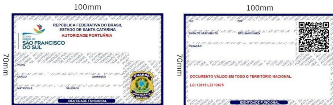
FIGURA 4 – MEDIDAS DA IDENTIFICAÇÃO FUNCIONAL EM PAPEL REFERÊNCIA